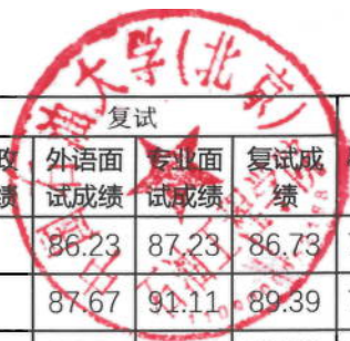
2026年石油工程学院硕士研究生拟录取名单