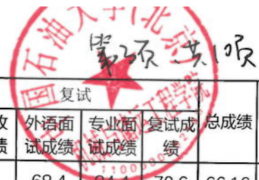
2025年机械与储运工程学院硕士研究生拟录取名单