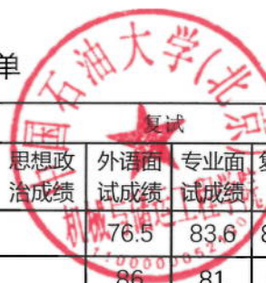
2025年机械与储运工程学院硕士研究生拟录取名单