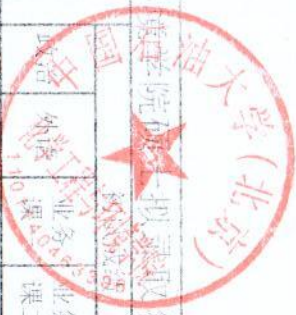
2019年化学工程与环...学院...录取名单